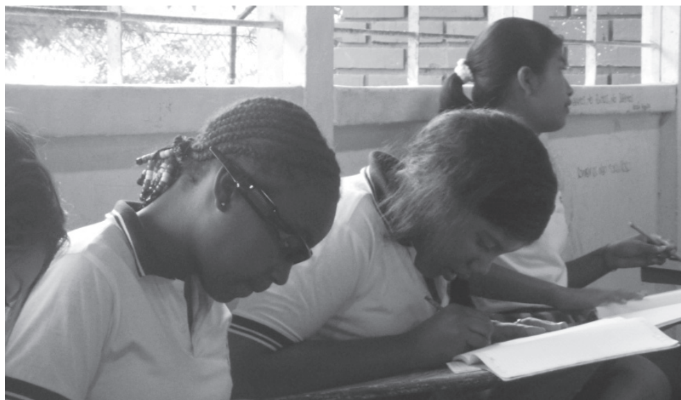
FIGURA 2 | Estudiante usando las gafas filmadoras

personal y de sus experiencias como estudiantes de matemáticas en las instituciones educativas. En segundo lugar, utilicé este mismo tipo de entrevistas para recolectar información acerca de las experiencias de los maestros en sus instituciones educativas, sus historias y sus expectativas sobre los estudiantes. Finalmente, una vez cada semana y utilizando episodios video grabados de sus clases y previamente seleccionados, entrevisté a los maestros participantes con el propósito de analizar a profundidad diferentes situaciones que tenían lugar en el salón de clase. Los planes de área y de clase, y los dispositivos didácticos como evaluaciones y talleres diseñados por los maestros fueron recolectados para ser analizados.